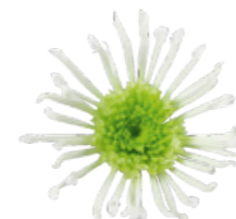
AAA Anura Green