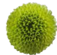
Madiba® Minty Boane