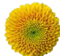
AAA Jeanny Orange