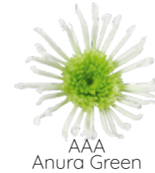
AAA Anura Green