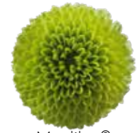
Madiba® Minty Boane