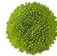
Feeling Green Dark