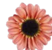
Yin Yang® Smokey