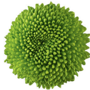
Feeling Green Dark