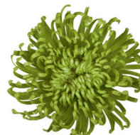
Anastasia® Dark Green