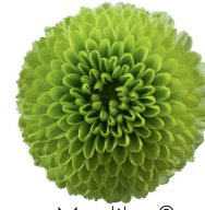
Madiba® Minty Boane