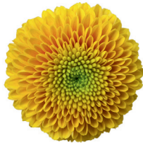
AAA Jeanny Orange