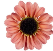
Yin Yang® Smokey