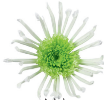
AAA Anura Green